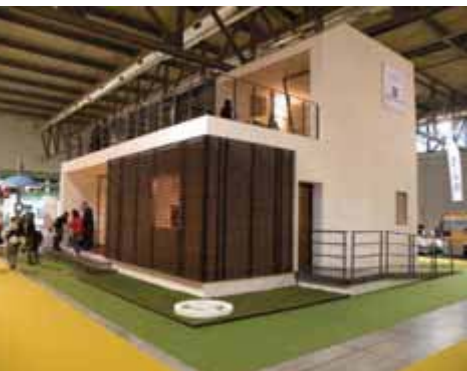
Immagine di "Casa CENED", edificio di classe A+ secondo lo standard di classificazione energetica di Regione Lombardia, progettato e costruito con l'obiettivo di illustrare le migliori tecniche costruttive ed impiantistiche per ottenere una casa a basso consumo energetico

Nella pagina a fianco: Palazzo Lombardia, nuova sede della giunta regionale lombarda